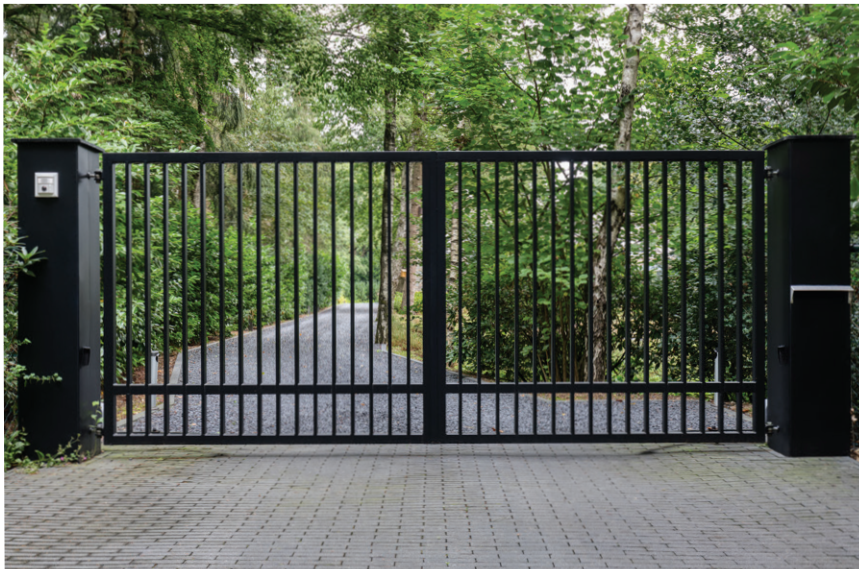
De complete toegangspoort werd geleverd door Van Ommeren Hekwerken uit Elst (Utrecht).

Dit project werd mede gerealiseerd door: