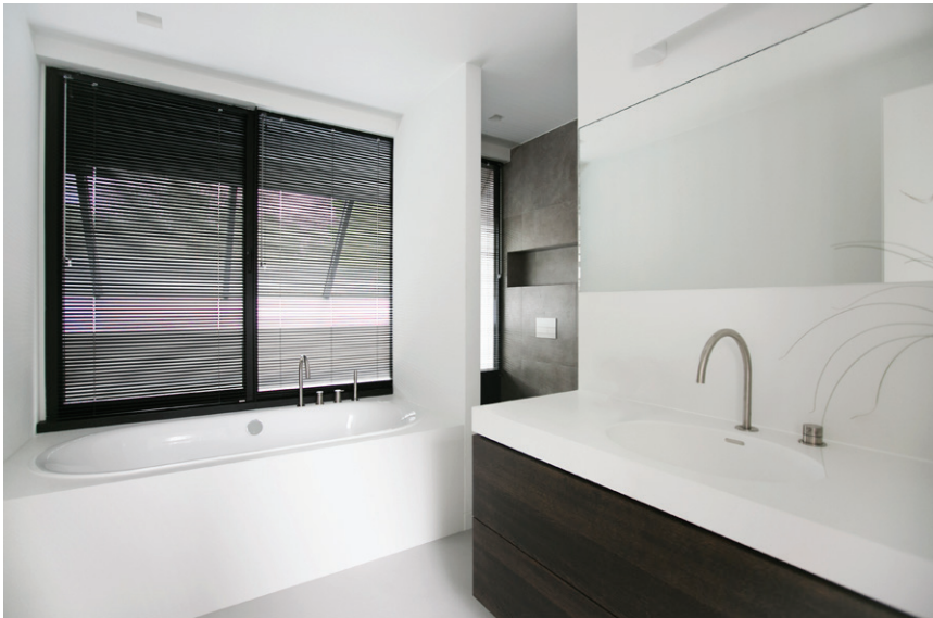
Mineraal beton is geschikt voor natte ruimtes en werd ook toegepast in de badkamers.

voor de entree en de ramen aan de voorzijde zijn, net als de woonkamer aan de achterzijde, bekleed met zink. Een lang, recht pad van antracieten tegels van Schellevis Beton leidt naar de opvallende entree, waarvan het glas, gevat in een stalen frame, tot voorbij de dakrand doorloopt. Een hoge glazen deur geeft toegang tot de ruime hal met links een deur naar het slaapgedeelte en rechts een deur naar het woongedeelte. Het glas vóór en achter geeft, samen met de glazen deuren links en rechts, licht, ruimte en zichtlijnen in alle richtingen. Een vide zet deze zichtlijnen door op de tweede verdieping. De vloer is op de gehele benedenverdieping uitgevoerd in licht mineraal beton.