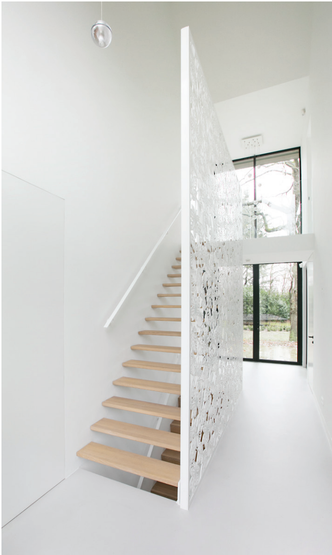
Op meerdere plaatsen in de woning komt het eikenhout terug, zoals in de open trap.