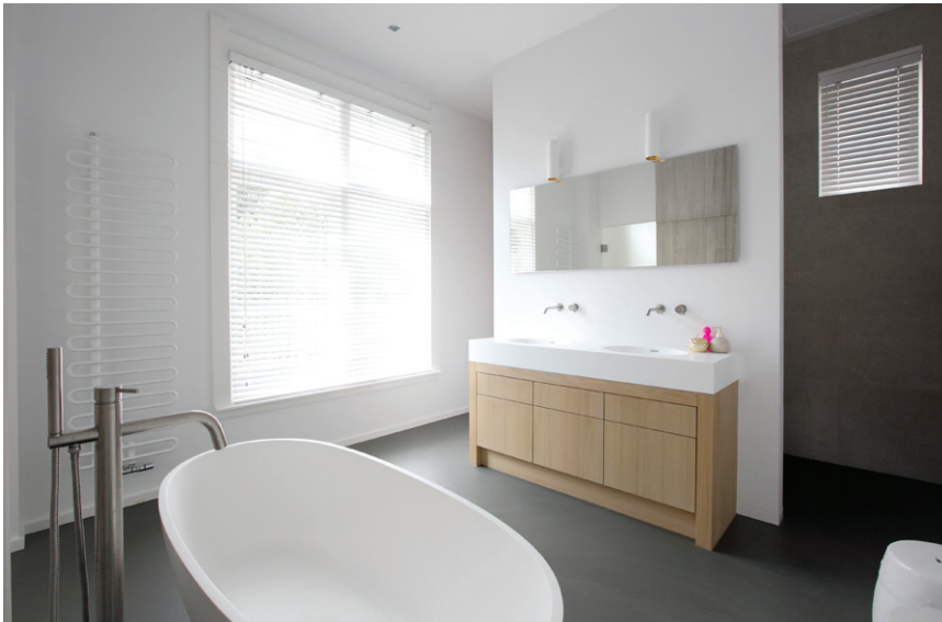
Natuursteen en een grijze vloer geven warmte aan de badkamer.