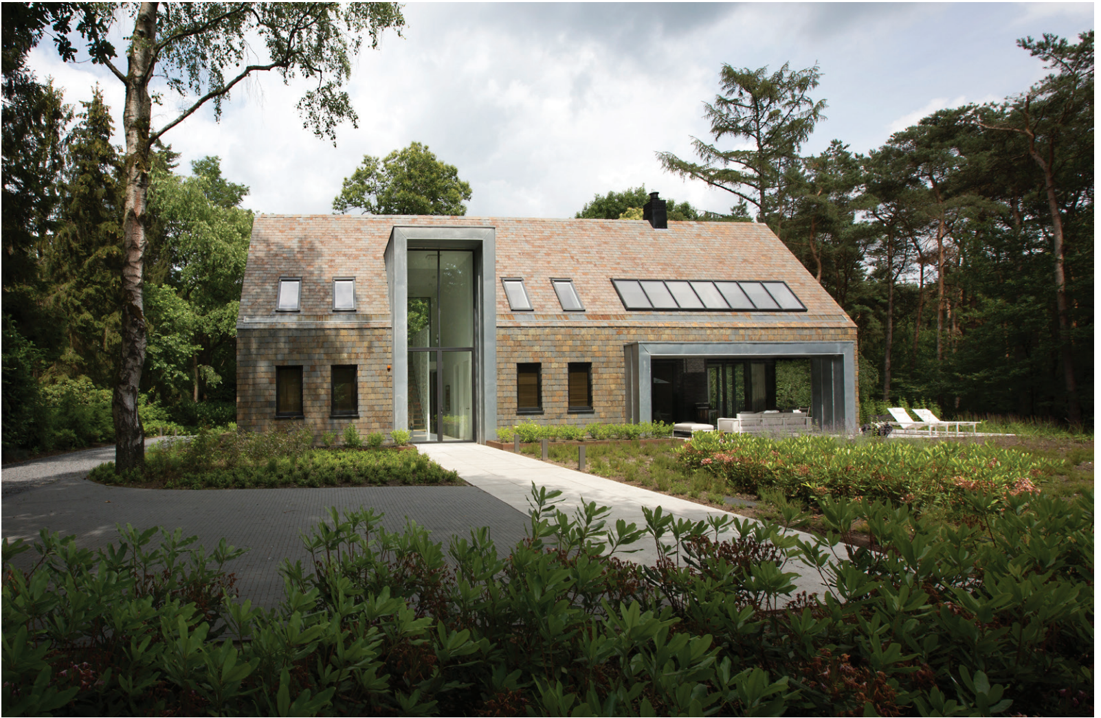
De leistenen voor het dak en de muren werden geleverd en geplaatst door Hegeraat Leidekkersbedrijf.