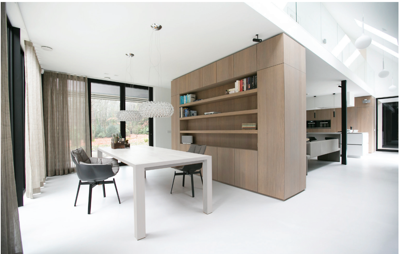
Leertower uit Barneveld was verantwoordelijk voor de elektrotechnische installatie en domotica installatie.

“De vloer is op de gehele benedenverdieping uitgevoerd in licht mineraal beton”