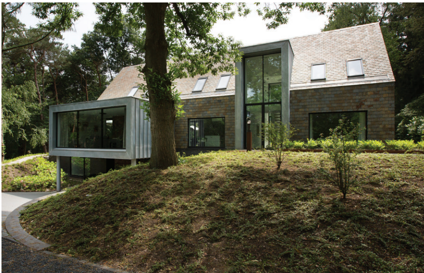
De bewoners kregen een natuurlijke tuin die direct toegang biedt tot de natuur.