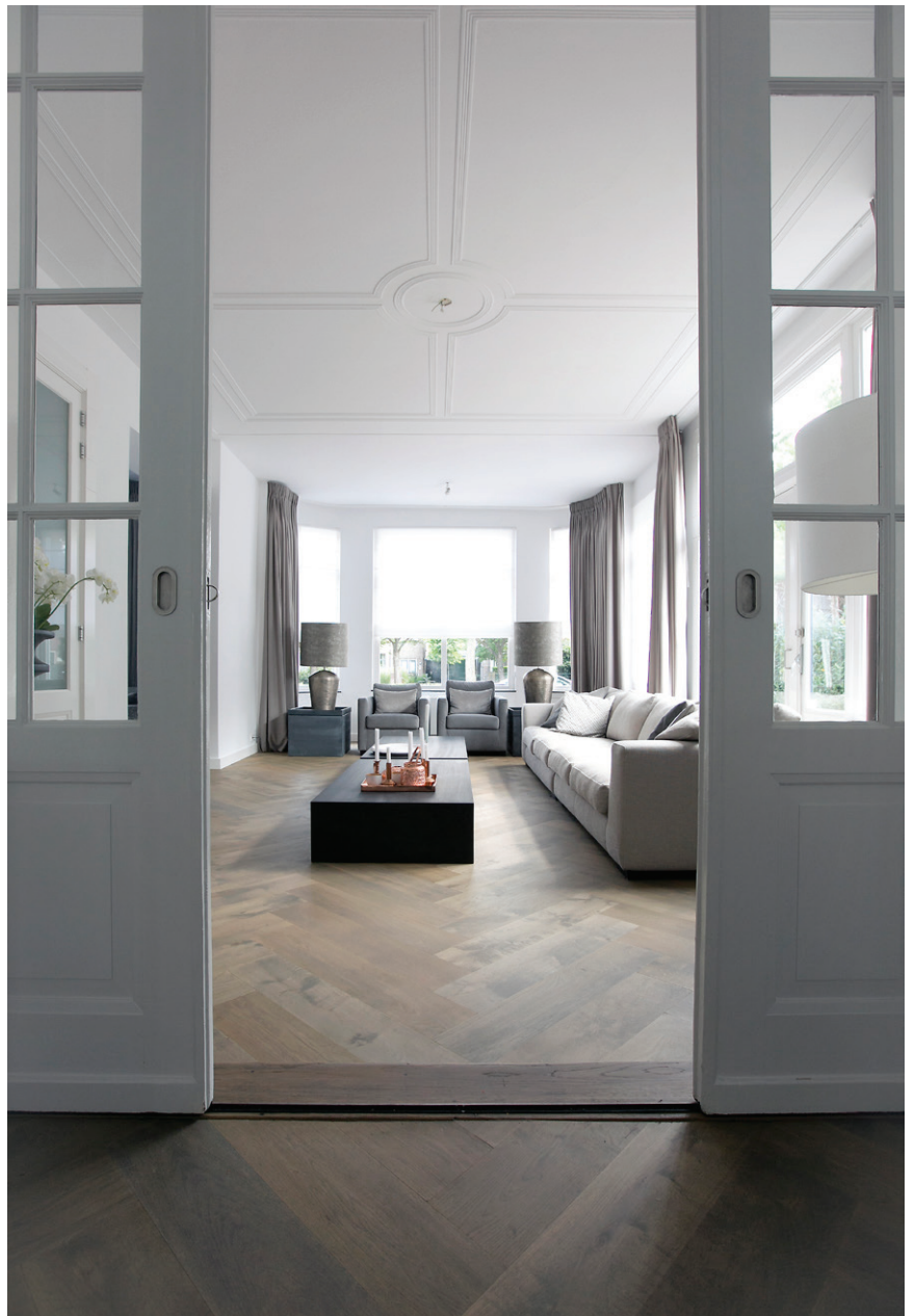
Dubbele glazen deuren bieden toegang tot de gezellige woonkamer.

De vloer in de hal was oorspronkelijk een vloer van marmer. De architecten kozen hier, in het toilet en in de badkamer, voor Chambolle tegels: natuursteen in een zachtgrijze tint, die warm aansluit bij het wit en zwart van de muren en het houtwerk. Een belangrijke