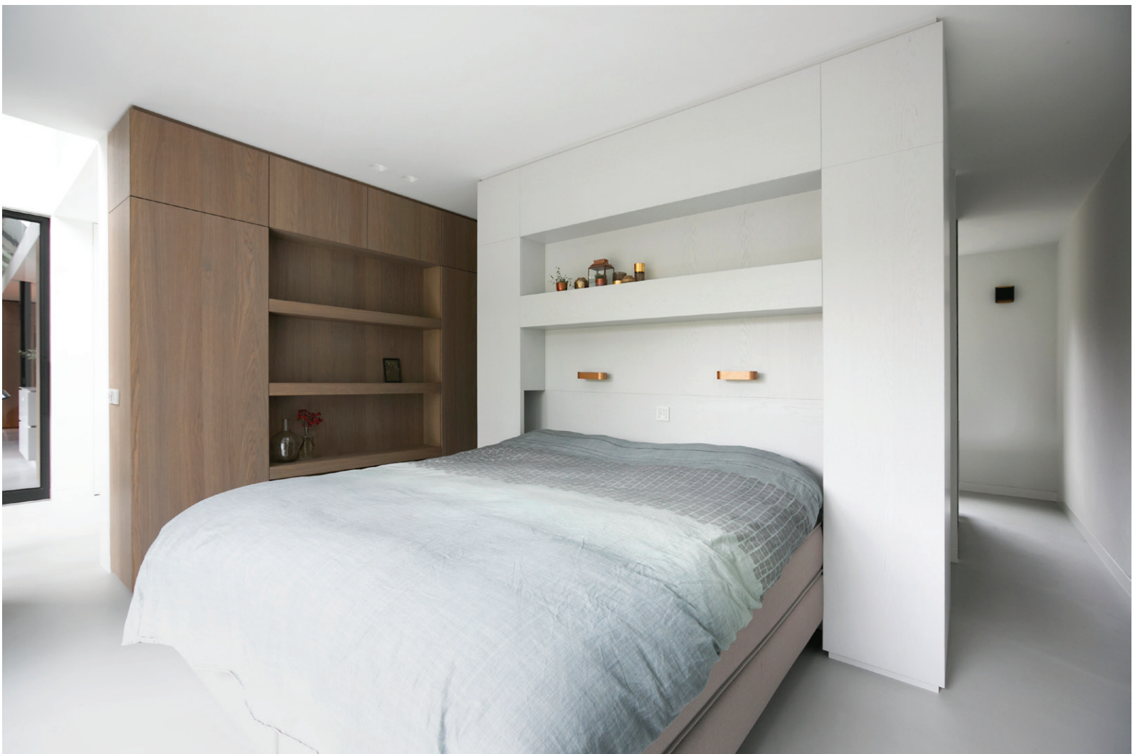
In de slaapkamer scheidt een kastenwand het slaapgedeelte van het badgedeelte.