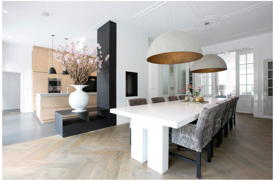
De keuken en het maatwerk interieur werden in deze villa gemaakt door Meubel- en Interieurbouw van den Hoek.

Van buiten is de in 2015 opgeleverde Nijmeegse woning een authentiek negentiende-eeuws herenhuis, met prachtige oorspronkelijke details. Van binnen zien we een lichte, moderne villa, die door zijn compleet vernieuwde plattegrond veel leef- en beweegruimte met sterke zichtlijnen kreeg. Marjolein Kap en Mijntje van der Berk: “De woning was in de jaren tachtig voor het laatst verbouwd. Met onze opdrachtgevers, de nieuwe bewoners van het huis, waren wij het eens dat dat niet helemaal meer van deze tijd was. Na de specifieke wensen van de bewoners te hebben besproken, zijn we aan het schetsen geslagen. Wij vinden het belangrijk dat de plattegrond van een huis klopt: de verhoudingen, de zichtlijnen, het licht en de routing. En dat ons ontwerp past bij de toekomstige bewoners. Wij laten altijd graag een paar verschillende ontwerpen zien, van behoudend tot gedurfd. Daaruit