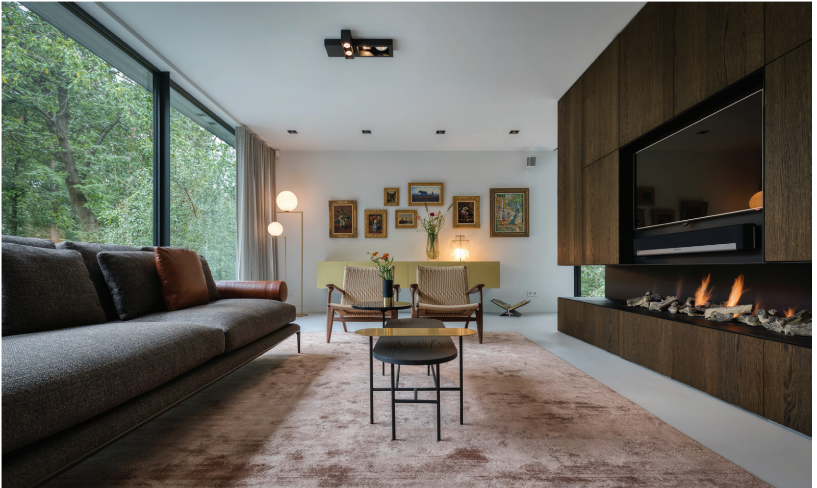
Het losse meubilair en de stoffering komen van Matser Interieur uit Wageningen.

“De vloer is op de gehele benedenverdieping uitgevoerd in licht mineraal beton”