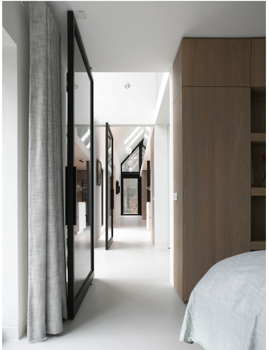
De Rooy Metaaldesign leverde de kozijnen en taatsdeuren.